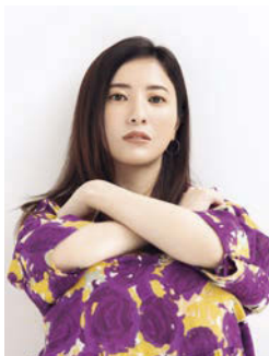
Cover Model 吉高由里子 Stylist 有本祐輔 (7回の裏) Hair&Make 足立典利子 Cover Design 太田友樹 (アティック)