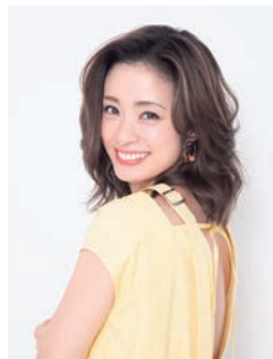
Cover Model 上戸 彩 Stylist 宮崎真純(ikkle more) Hair&Make 中谷圭子(AVGVST) Cover Design 橋田浩志(アティック)