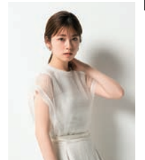
ヘア&メイク / 竹下あゆみ スタイリング / 成田佳代 モデル / 小芝風花 デザイン / ma-h gra 衣装協力 / ベスト 2万8600円 (KOH'S LICK CURRO ☎03-6427-1405)、イヤリング1万3640円 (TODAYFUL / LIFE's 代官山店 ☎03-6303-2679)、ハンブル4万4000円(e.m. / e.m. 青山店 ☎03-6712-6797)ほか イラスト私物。 ※価格は税込。